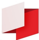
Rysunek nr. 2